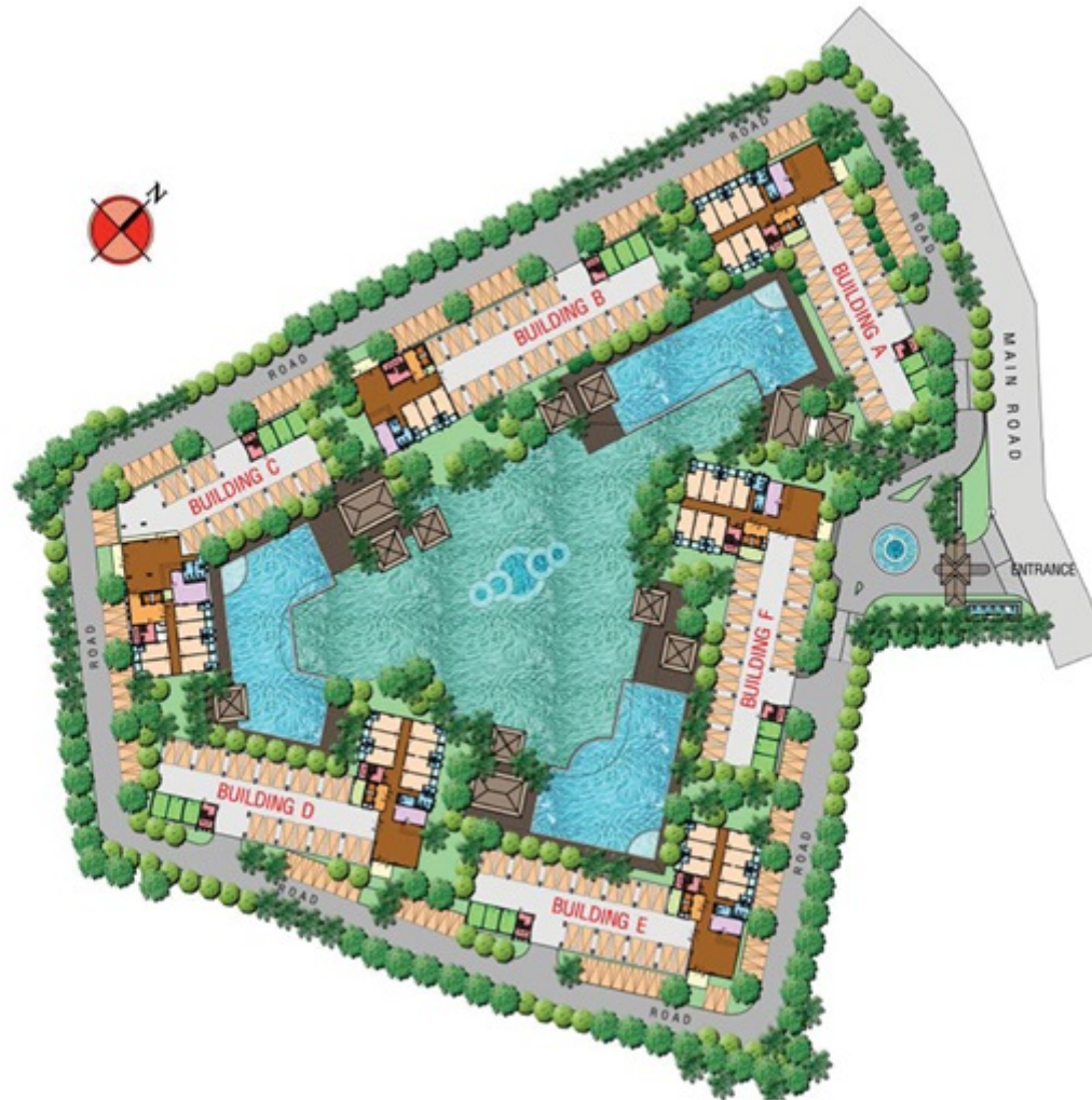
ภาพที่ 5 ผังพื้นที่สีเขียวโครงการ (ตั้งอยู่ชั้นล่างทั้งหมด)